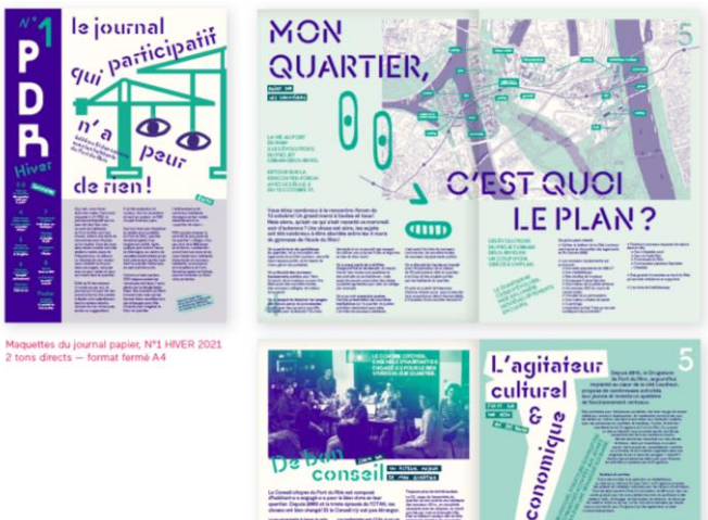
Maquettes du journal papier, N°1 HIVER 2021 2 tons directs — format fermé A4