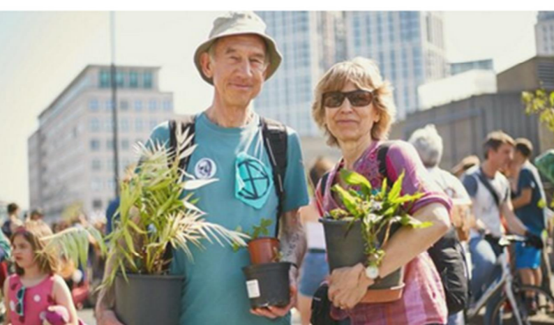
La communication non-violente