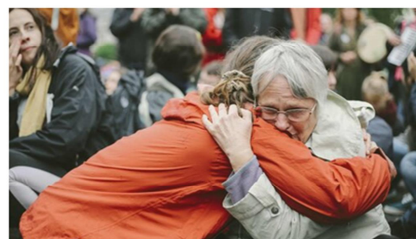
Les cercles d'empathie