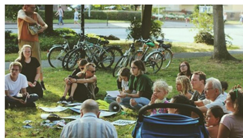
La résolution des conflits