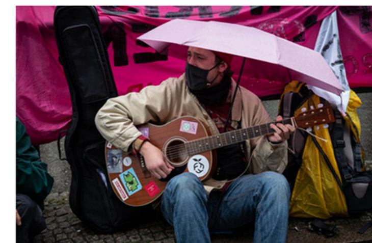
Bien-être pendant l'action