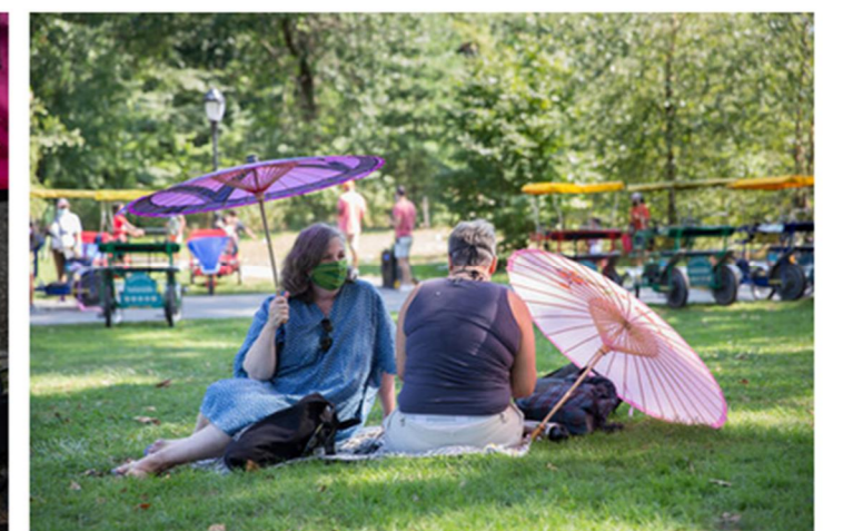
Soins après l'action